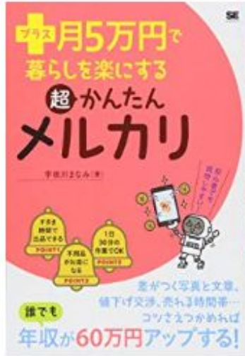
プラス月5万円で暮らしを楽しむ 超かんたんメルカリ