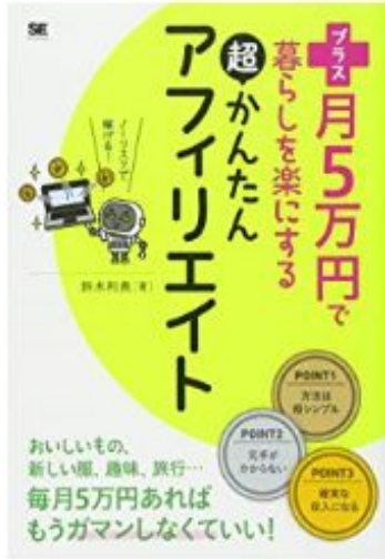
プラス月5万円で暮らしを楽しむ 超かんたんアフィリエイト